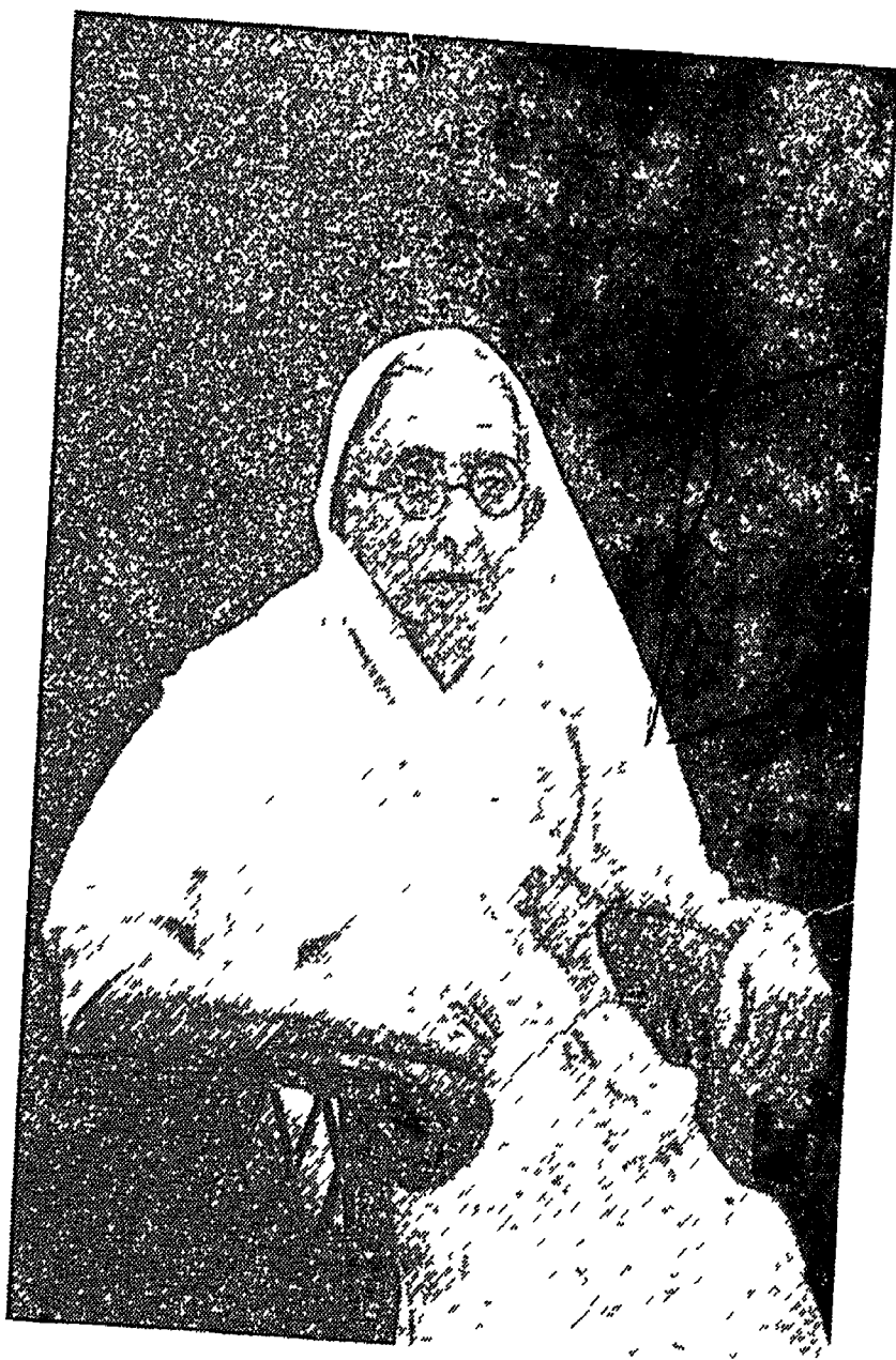
श्रीमती स्वरूपरानी नेहरू